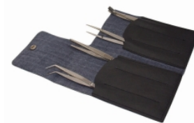
Набор пинцетов LLG, 4 штуки, хромоникелевая сталь

Набор пинцетов LLG, 4 штуки, из хромоникелевой стали в футляре из синтетической кожи включает в себя: