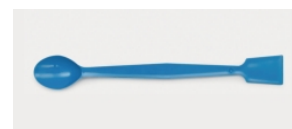
LLG- Макро ложка-шпатель, ПП

Состоит из ложки на одной стороне, которая позволяет легко переносить образцы, в то время как другой конец плоской конструкции с острием ножа может быть использован для переноса соли или дробления кристаллических материалов.