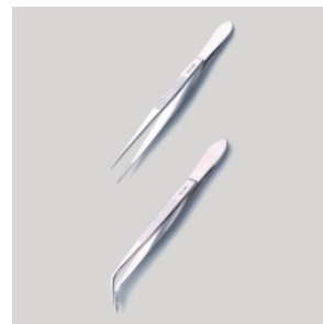
LLG Пинцеты анатомические, сталь 420

Изготовлены из высококачественной полированной нержавеющей стали, с острыми концами и рифлением.