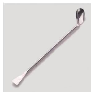
LLG Ложка-шпатель, сталь 18/10, Полированная