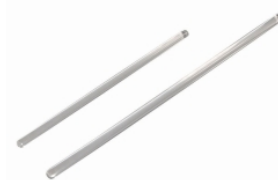
Палочки стеклянные для перемешивания LLG, натриево- кальциевое стекло