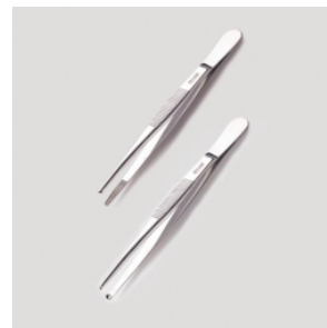
Пинцет, 18/10 стальной

Материал - нержавеющая сталь 18/10. Подпружиненный. незаостренный прямой.