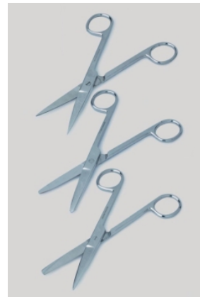
Универсальные ножницы LLG, нерж. сталь