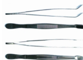
Пинцет для предметного стекла LLG, тип Кюне, нержавеющая сталь