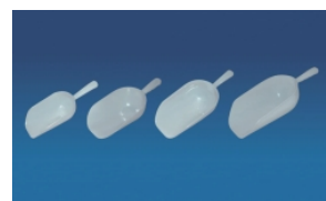
Мерные совки, ПЭВП

Для промышленного использования. Подходят для продуктов питания.